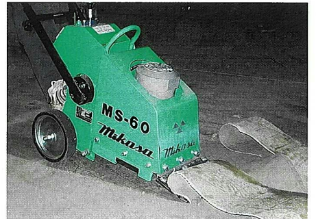
クッションフロア