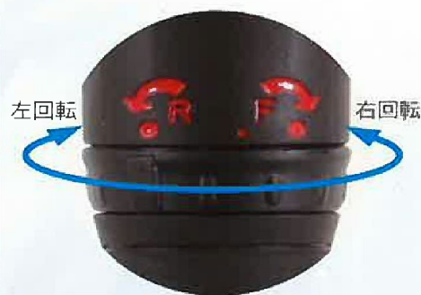
■リバースバルブ 右回転 2段階切替