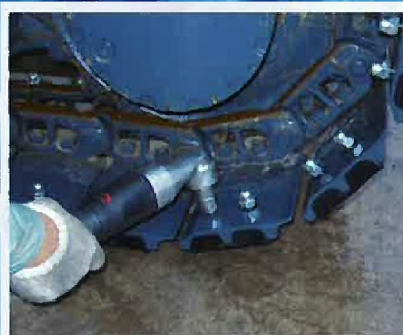
■建設機械メンテナンス