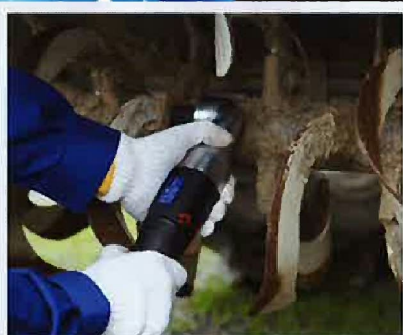
■農機具メンテナンス