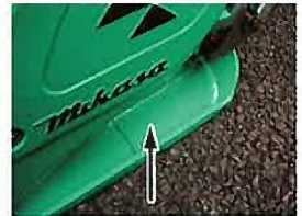
転圧盤二重構造 (F60・70系)

転圧盤全面に制振樹脂を充填し鉄板の共振を防止します。 また、作業の際、最も摩耗する後部を二重構造にしてありますので耐久性が向上しました。