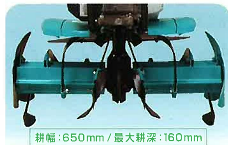
耕幅:650mm / 最大耕深:160mm