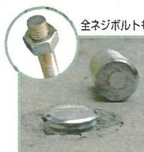
わずか数ミリのツラ切断