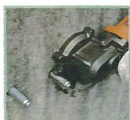
アンカーボルトの除去