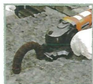
不要な鉄筋をツラで切断