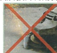
火花も少なくきれいで早く