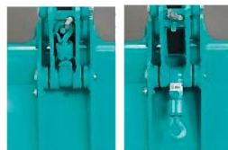
クレーン格納時 クレーン使用時