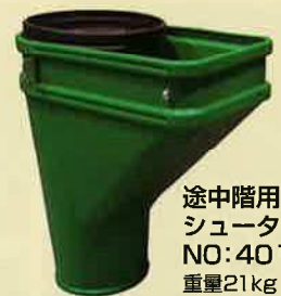
途中階用 シューター NO: 4012 重量21kg シューター材質: ポリエチレン (PE)